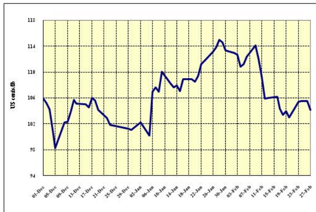
Gráfico 4: Preços indicativos diários dos Naturais Brasileiros 1º de dez. de 2008 a 27 de fev. de 2009