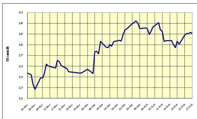
Gráfico 2: Preços indicativos diários dos Suaves Colombianos 1º de dez. de 2008 a 27 de fev. de 2009