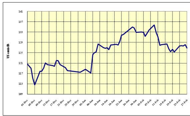
Gráfico 3: Preços indicativos diários dos Outros Suaves 1º de dez. de 2008 a 27 de fev. de 2009