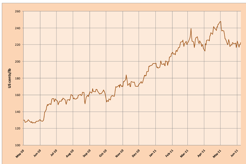
Gráfico 1: Preço indicativo composto da OIC Evolução diária: 3 de maio de 2010 a 10 de junho de 2011