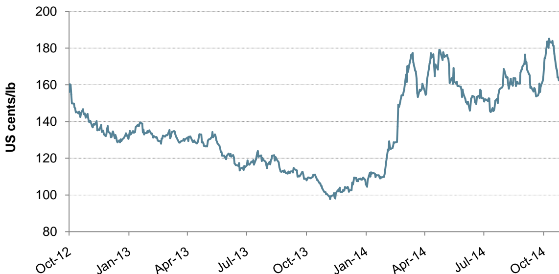
Gráfico 1: Precio indicativo compuesto diario de la OIC

© 2014 International Coffee Organization ( www.ico.org )