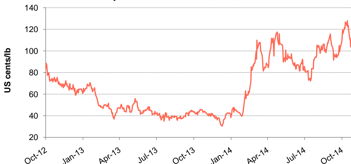
Gráfico 3: Arbitraje entre los mercados de futuros de Nueva York y Londres