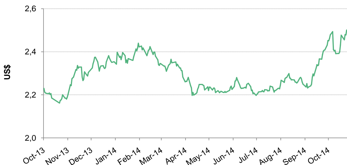
Gráfico 5: Tasa de cambio del real brasileño con el dólar estadounidense