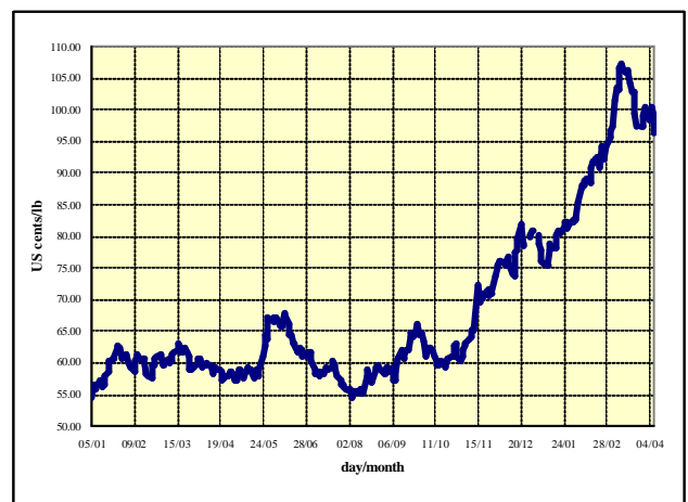
Gráfico 1: Precio indicativo compuesto diario 5 enero 2004 – 8 abril 2005

El promedio mensual del precio indicativo compuesto de la OIC fue en marzo de 101,44 centavos de dólar EE UU por libra, frente a 89,40 centavos en febrero de 2005, lo que representa un aumento del 13,47% en un mes. En datos diarios, el precio indicativo compuesto subió el 11 de marzo a 107,36 centavos de dólar por libra antes de volver a bajar a 100,47 centavos el 31 de marzo de 2005. La evolución de los precios en la primera semana de abril indica un retroceso que se puede atribuir principalmente a la toma de beneficios de los fondos de inversión. El Gráfico 1 muestra la evolución diaria del precio indicativo compuesto de la OIC 1 a partir del 5 de enero de 2004.