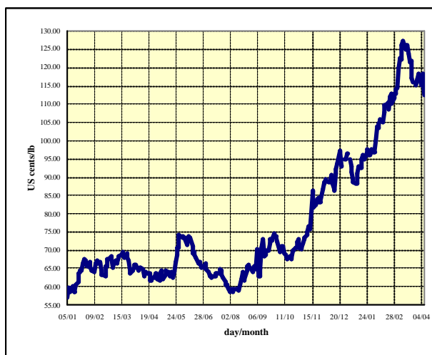
Gráfico 5: Precios indicativos diarios de los Robustas 5 enero 2004 – 8 abril 2005