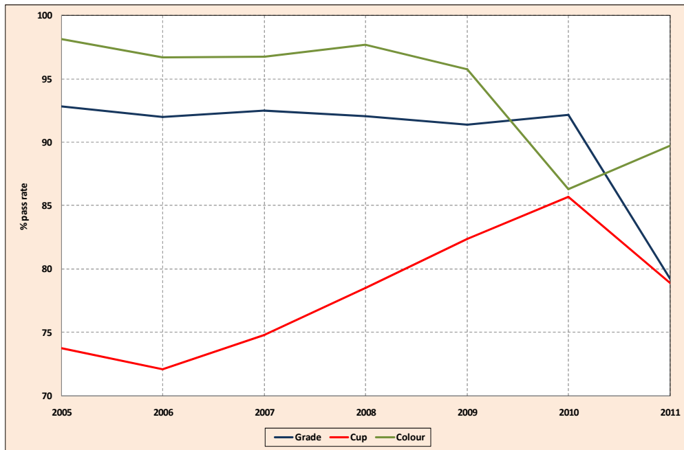
Gráfico 1: Resultados del análisis de grado, taza y color de ICE Años civiles de 2005 a 2011

4. En resumen, el nivel general de “aprobados” de ICE en el análisis de la clasificación del contrato “C” del café fue del 70% en el año civil 2011. Este es el porcentaje más bajo que se registra desde que se aplica el Programa de Mejora de la Calidad del Café, dado que en 2006 el nivel general de “aprobados” fue del 79,7%.